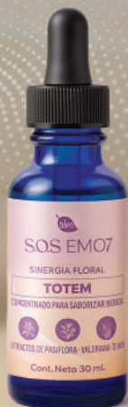
SINERGIA FLORAL Totem Cont. neto 30 ml