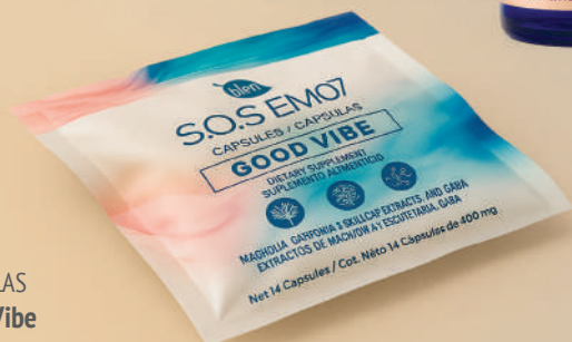
CÁPSULAS Good Vibe