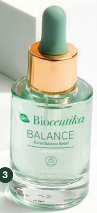
Equilibrante Facial Balance Cont.neto 30 ml