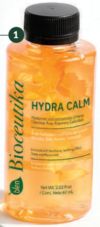
Hydra Calm Cont.neto 60 ml

Detén el avance de la edad con Bio-ReNovel y activos botánicos diseñados para suavizar visiblemente los signos de la edad: arrugas, flacidez, falta de luminosidad y manchas. Para mejores resultados úsalo con el Estimulador facial.