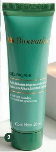
Gel Facial-B Cont.neto 50 ml